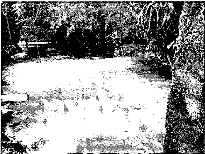
Fotografía 1. Sitio de construcción aletas del box existente

Se plantea la construcción de dos aletas en concreto reforzado con longitud de 4 m cada una y altura total de 3.7 m.