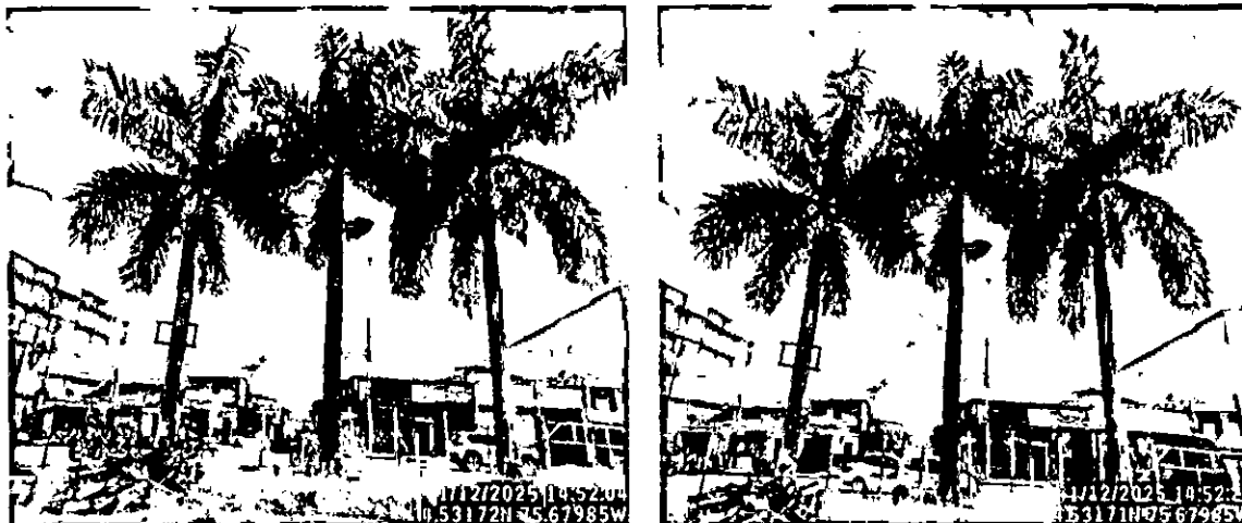
Fotografía 1, 2. Individuos arbóreos de la especie Palma botella ( Roystonea regia (Kunth) O.F.Cook)