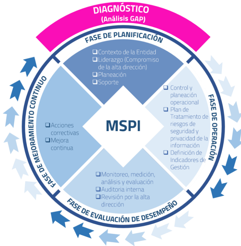
Figura 1. Ciclo del Modelo de Seguridad y Privacidad de la Información