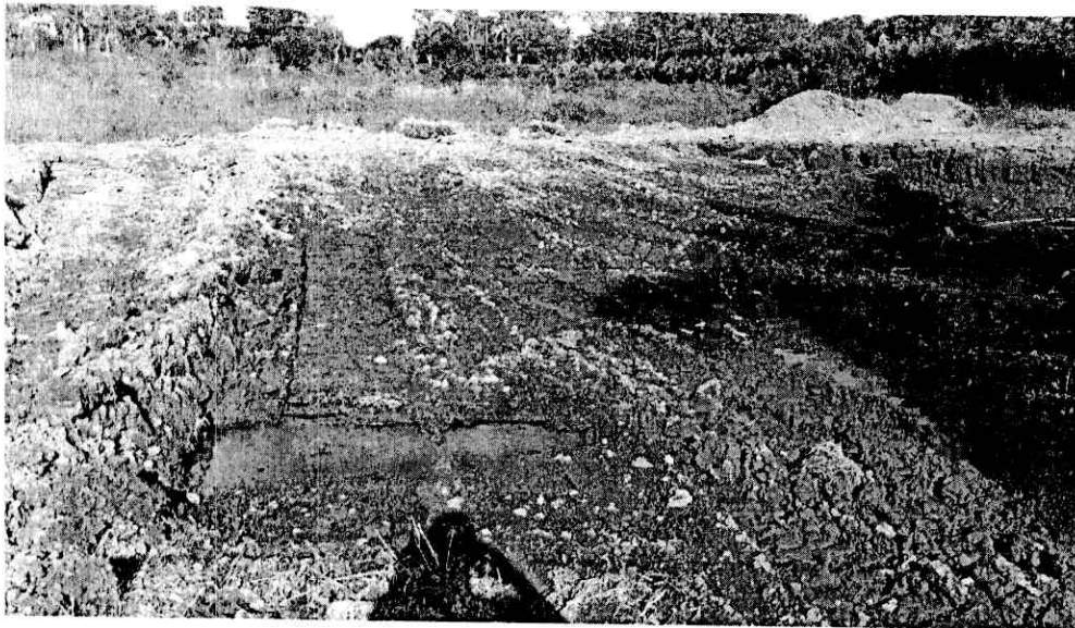
Lámina de Agua Remoción de tierra de Humedal Hacienda El Cabrero