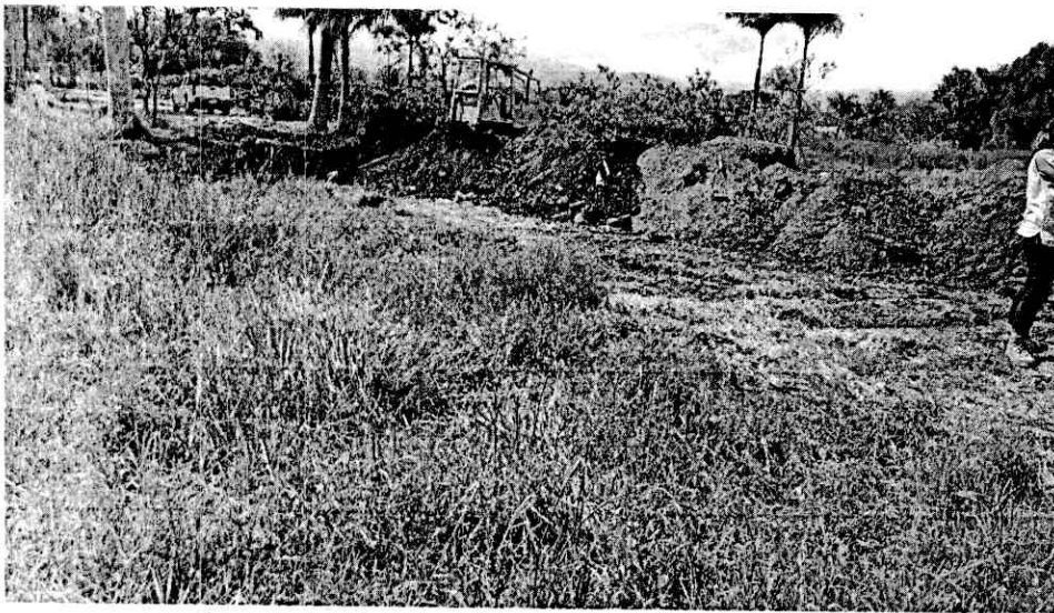
Figura 6: Afectación del Humedal