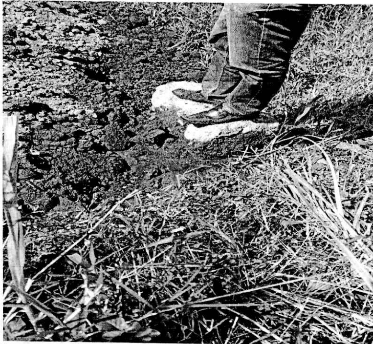
Figura 4. Fuentes hídricas en el área del humedal.

Paso seguido del reconocimiento del sitio y de realizar la evaluación del área del humedal ( ver figura 4 ) como sus condiciones topográficas, de composición florística la presencia de una lámina de agua y con base en la bibliografía, se considera que es una área de descarga acuífera (catalogación de humedal) sumado al tipo del uso del suelo con el que cuenta (bosque de galería) alrededor del predio, se establece una relación directa con un sistema hídrico. Por consiguiente, esta zona tiene un gran valor ambiental, a demás esta área de descarga juega un papel importante en el entorno, evitando eventos naturales como inundación en épocas de lluvias constantes.