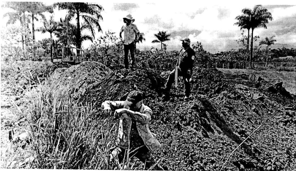
Figura 3: Zona Llenado Humedal

Después de evaluar el área, tomar las coordenadas geográficas, el registro fotográfico y analizar las corrientes hídricas en una escala de 1:10.000 en el Sistema de Información Geográfica de la CRQ, se encontró que la zona demarcan afluentes hídricos en la zona, las cuales fueron corroboradas en campo y se evidencian fotográficamente ( figura 3 y 4 ).