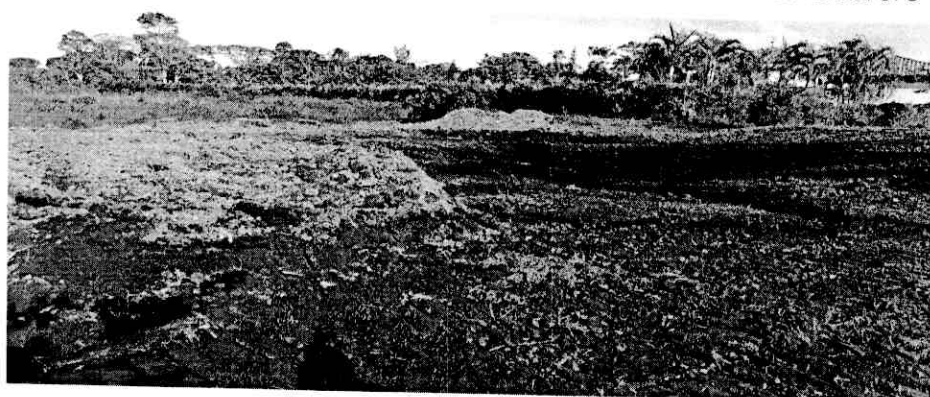
Figuras 3 y 4. Remoción de tierra de Humedal Hacienda El Cabrero

Se observa en el sitio del Humedal en la Hacienda El Cabrero que la medida impuesta por la Corporación Autónoma Regional del Quindío se está respetando dando cumplimiento a lo estipulado en el acta No. 10951 y ratificada en la Resolución 1718 de Julio 7 de 2017; La constructora de la obra Hacienda el Cabrero Casas de Campo NO está depositando más material de descapote sobre el Humedal desde el día 4 de julio de 2017 y no se encuentra ninguna maquinaria el área del Humedal, se está retirando este material del Humedal y se observa la lámina de agua del humedal debajo de la tierra verificando la afectación ocasionada por este material de descapote. (figuras 3 y 4).