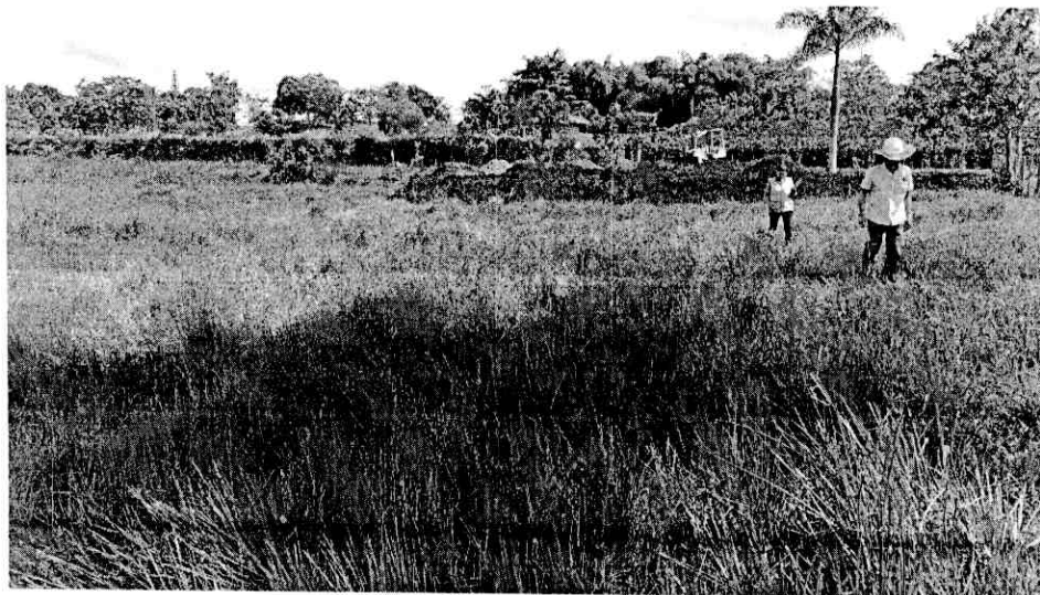
Figura 2: Zona afectada del Humedal