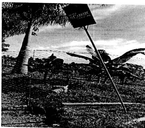
Figuras 1 y 2. Cierre de paso de Ganado al Humedal Hacienda El Cabrero