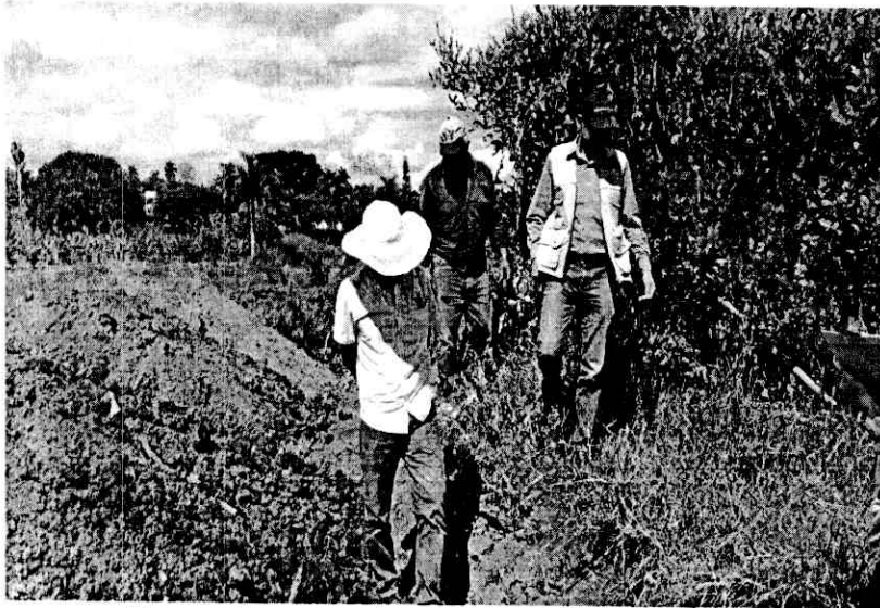
Figura 5: Medición.