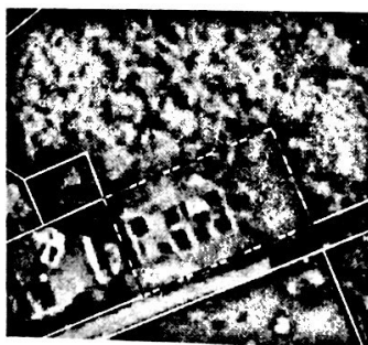
Imagen 1. Localización geográfica predio Villa Sonia

La Corporación Autónoma Regional del Quindío, en cumplimiento de las funciones constitucionales y legales, realiza actividades de vigilancia, seguimiento y control en el área de su jurisdicción, propendiendo porque el desarrollo que se busca para el Departamento del Quindío sea sostenible; unas de las tareas antes citadas, se enfoca en la verificación del cumplimiento de las normas ambientales por parte de las actividades generadoras de vertimientos descargados a cuerpos de agua, al suelo y/o al alcantarillado, con el fin de que se mitiguen los impactos ambientales y sociales que se pueden presentar y se prevengan daños sobre los recursos naturales. En cumplimiento de estas labores, a través de equipo técnico adscrito a la Subdirección de Regulación y Control Ambiental, se identificó vertimiento descargado al suelo el cual proveniente del predio Villa Sonia, en el cual se desarrollan actividades de tipo doméstico o residencial localizado en la Vereda San Juan de Carolina del municipio de Salento, Quindío, específicamente en las coordenadas 4°35'02" y -75°37'54", cuenta con matrícula catastral N° 636900000000100258000000000, en la imagen 1 se ilustra la localización geográfica del predio.