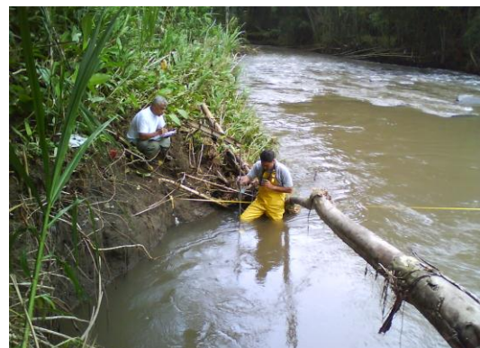
Medición de Aforos en el río Roble sector La Española en Quimbaya.

El río Roble que en Mayo presentaba un nivel de 1,1 mm en el sector de la Española en Quimbaya al mes de julio había descendió a 0,60 m.